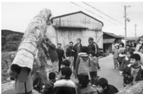
▲大蛇を担いで練り歩く子供ら

その後、倭文小学校児童らが大蛇を担ぎ、「祝いましよ、祝いましよ」の掛け声をかけながら同地区内を練り歩き、最後にムクの古木に巻きつけました。