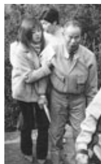
▲手を携えて山頂へ